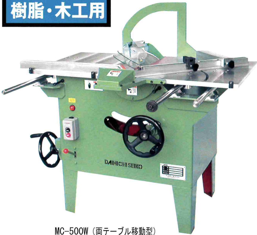
MC-500W (両テーブル移動型)