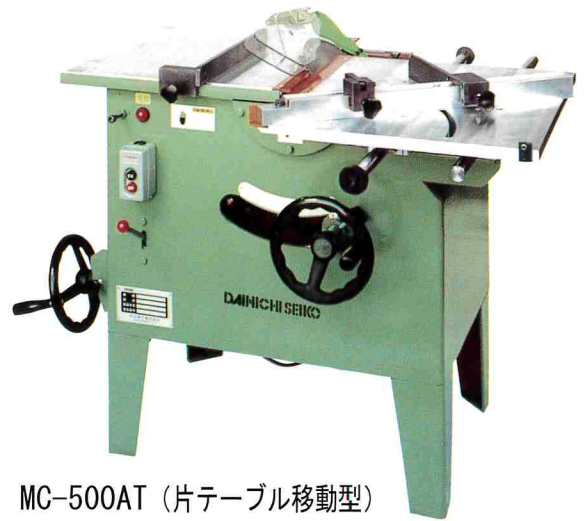
MC-500AT (片テーブル移動型)